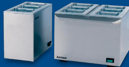
Tetrapackerhitzer geeignet für drei und sechs Tetrapack je ein Liter.